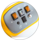
Panneau de commandes