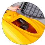
Débris tray + filtre