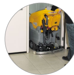
... et compact