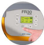
Fonction mode silencieux