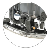
Système d'essuyage réglable...