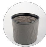
Filtre en Tissu-Non-Tissu (en option)