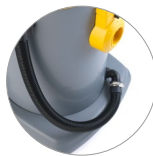
Tuyau d'évacuation pour évacuer les liquides présents dans le conteneur (PD)