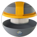
Filtre à cartouche en PTFE (classe de filtration M)