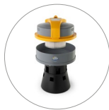
Ultra FilteRing System