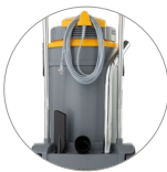
Porte accessoires et porte câble