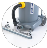
Barre d'aspiration (en option)